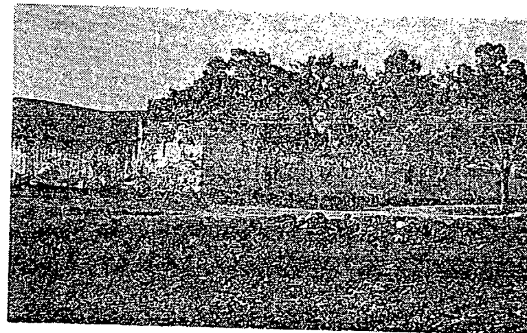
Vista exterior. (Foto Gómez).

Por otra parte no debemos olvidar que para hacer el uso debido de las aguas minerales es indispensable que preceda el conocimiento de las sustancias en disolución, para que los médicos puedan hacer aplicaciones razonadas, pues, de lo contrario, se procedería empíricamente y por rutina.