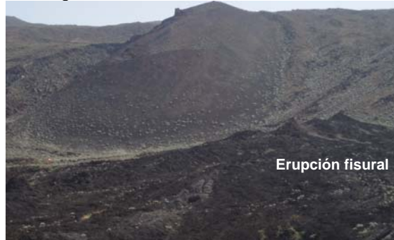
Fig. 2: Erupción basáltica fisural al NE del Volcán Orchilla.

La erupción volcánica se prolonga a lo largo de una fractura, transversal a las curvas de nivel, de dirección ENE-WSW, con una diferencia en altura inferior a los 30 metros y de aproximadamente 350 m de longitud (Fig. 2). A lo largo de la fisura efusiva es posible reconocer más de 25 pequeñas bocas eruptivas asociadas a 16 hornitos de tamaño y morfología diferentes.