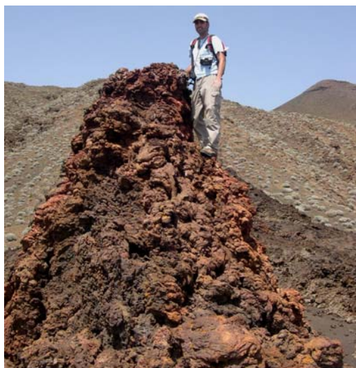
Fig. 4: Hornito torreado generado durante la erupción.

Todos estos hornitos desarrollaron comportamientos eminentemente efusivos, con la emisión de lavas muy fluidas de morfología pahoehoe. Sólo en aquéllas edificaciones más complejas se puede advertir cierta especialización dinámica de sus bocas eruptivas. Los cráteres ubicados a mayor altura se centran en procesos de desgasificación con emisión de productos tipo spatter que van edificando los hornitos; mientras que los emplazados a menor cota, se especializan en la emisión de lavas, de manera que es habitual la asociación boca-canal y/o tubo volcánico. Aunque la diferencia altitudinal entre los extremos de la fractura es escasa (<30 m), también se observa cierta especialización de los hornitos, siendo éstos dinámica y morfológicamente más complejos desde el WSW al ENE.