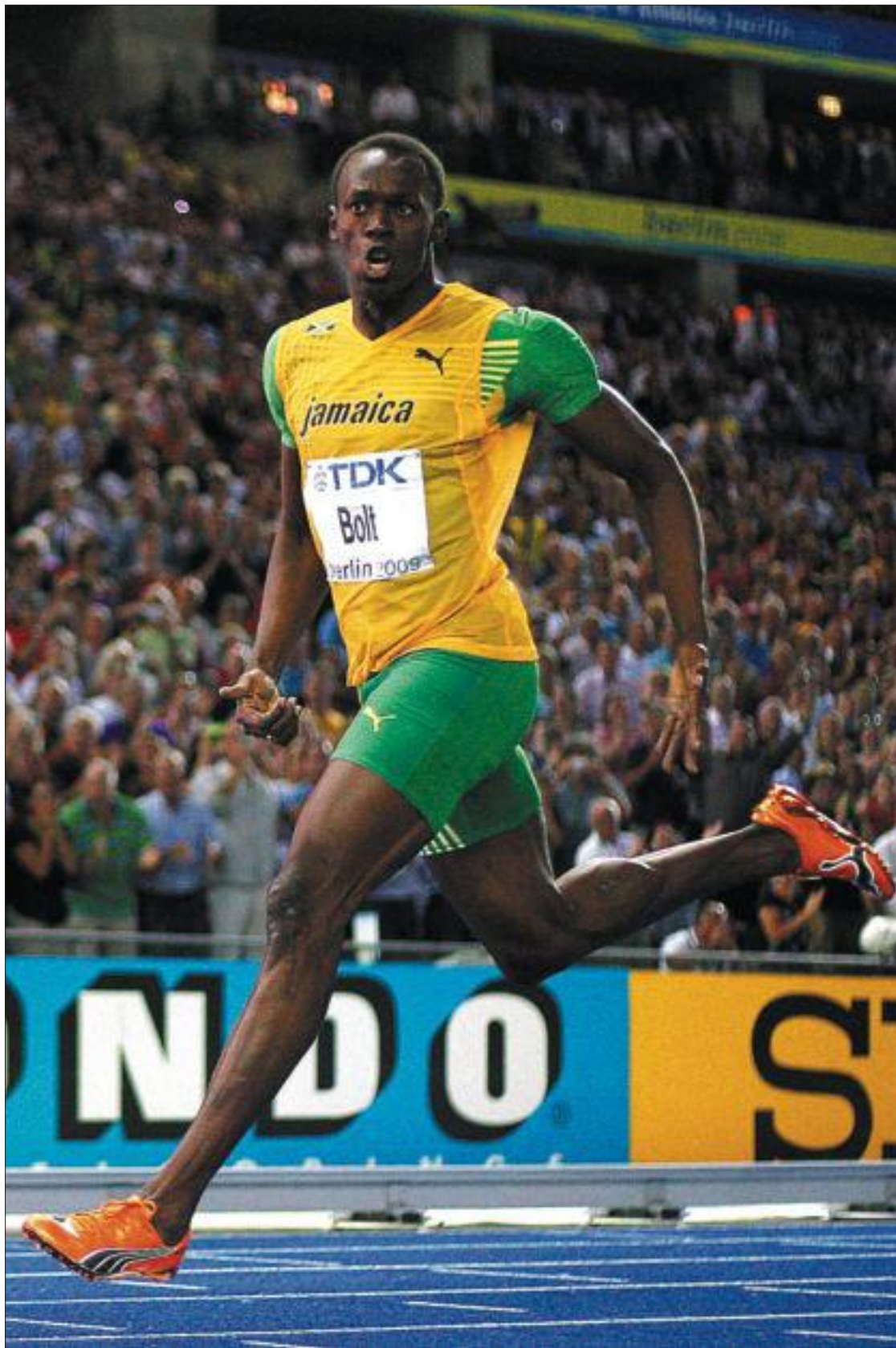
Usain Bolt se gira para mirar el cronómetro tras cruzar la meta en la final de 200 metros.

Hubo una salida nula. La protagonista el francés Alerte —no podía apellidarse de otra manera, quizás—, quien, de paso, salvó la piel a Bolt, quien se había quedado clavado en los tacos. Mientras Alerte hizo saltar la alarma por salir con un tiempo de reacción inferior a las 100 milésimas, los demás finalistas, excepto Bolt, reaccionaron en la zona de las 150 milésimas, la habitual. Sólo Bolt se durmió: 357 milésimas. Si la salida hubiera sido válida, no se su-