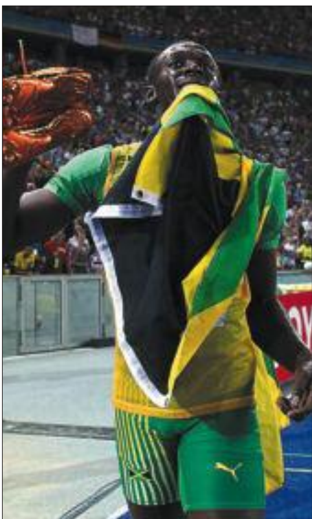
Bolt, con sus zapatillas y la bandera jamaicana tras su victoria en los 200 metros.

A los resultados de Bolt en el 100 y 200 de Berlín se les presupone aún un cierto margen de mejora. El biólogo Mark Denny pronosticaba el límite del 200 en 18.60s. Daba mayor margen a la mejora en el 200 (un 3,68% en la velocidad media) que en el 100 (un 2,22%) hasta que el hombre encuentre su barrera.