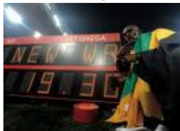
Usain Bolt posa junto al marcador tras batir el récord del mundo de los 200m en 2008 y 2009