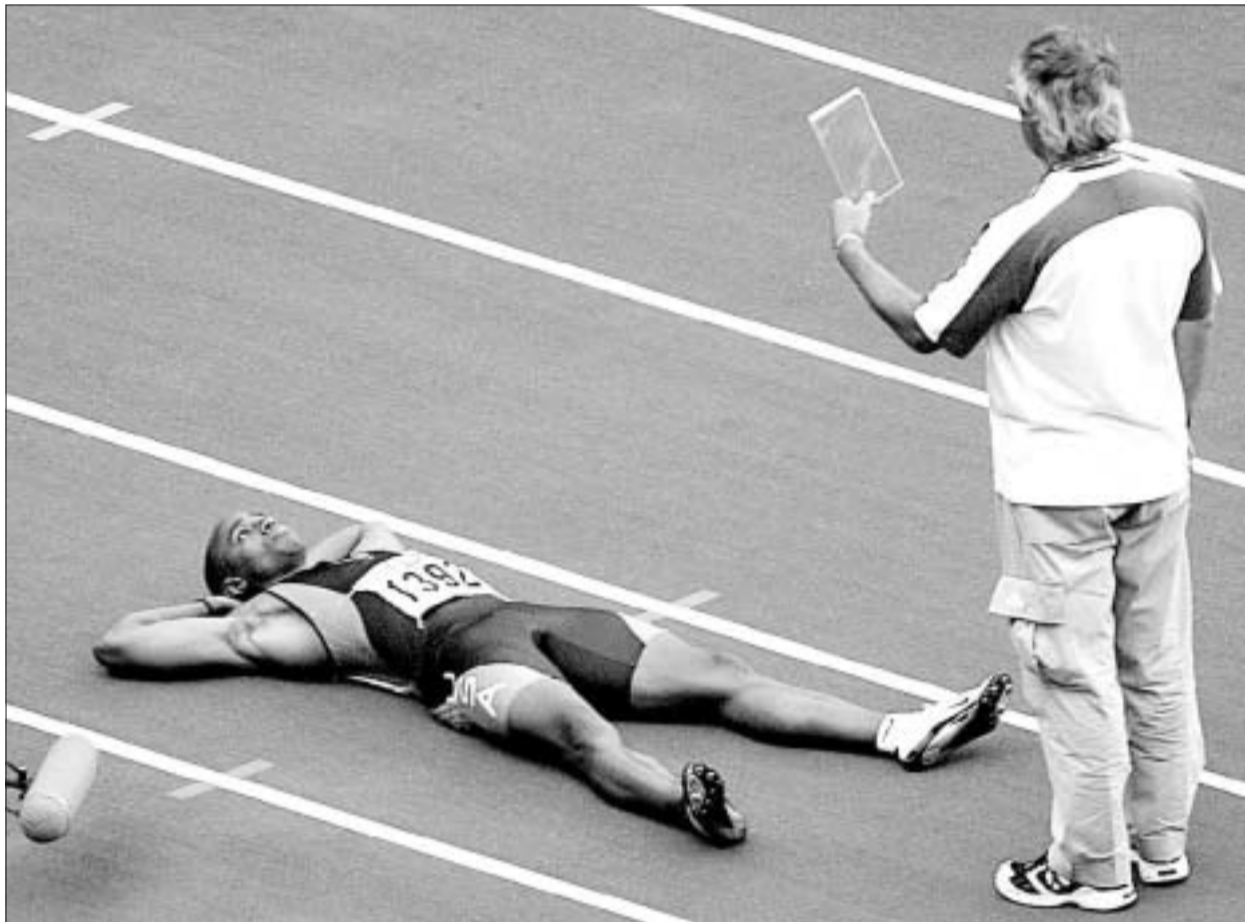
Jon Drummond, tumbado en la pista en señal de protesta por lo que consideró una descalificación injusta.

Se produjo primero una salida nula del jamaicano Dwight Thomas, que reaccionó en sólo 87 centésimas de segundo —el tiempo límite aceptado es de una décima de segundo, lo que se considera ya respuesta fisiológica al estímulo del sonido—. Después, cuando